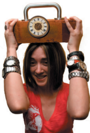
Una usuària fashion victim, usuària del ReloGero

So precise and punctual, that you shit in it.